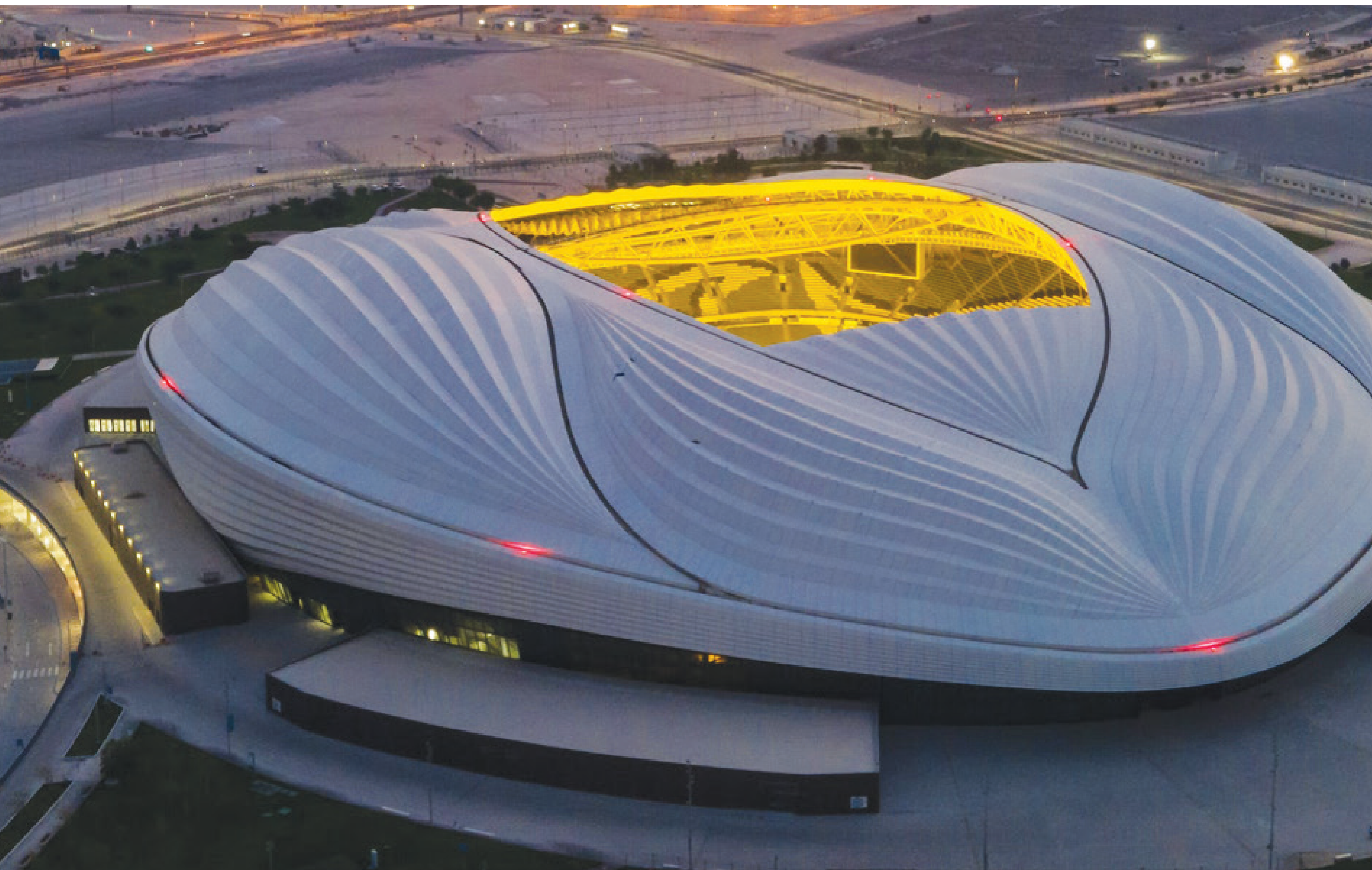
Guardate che spettacolo! Questo monumento è stato costruito per l'inaugurazione e la fnalissima delle partite di calcio del campionato del mondo 2022 nel Qatar..