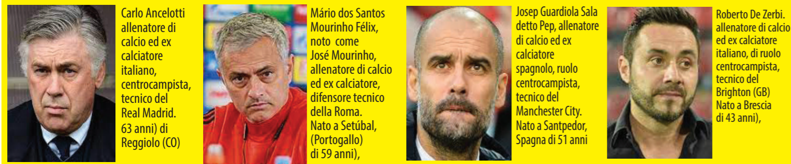
Carlo Ancelotti allenatore di calcio ed ex calciatore italiano, centrocampista, tecnico del Real Madrid. 63 anni) di Reggio (CO)